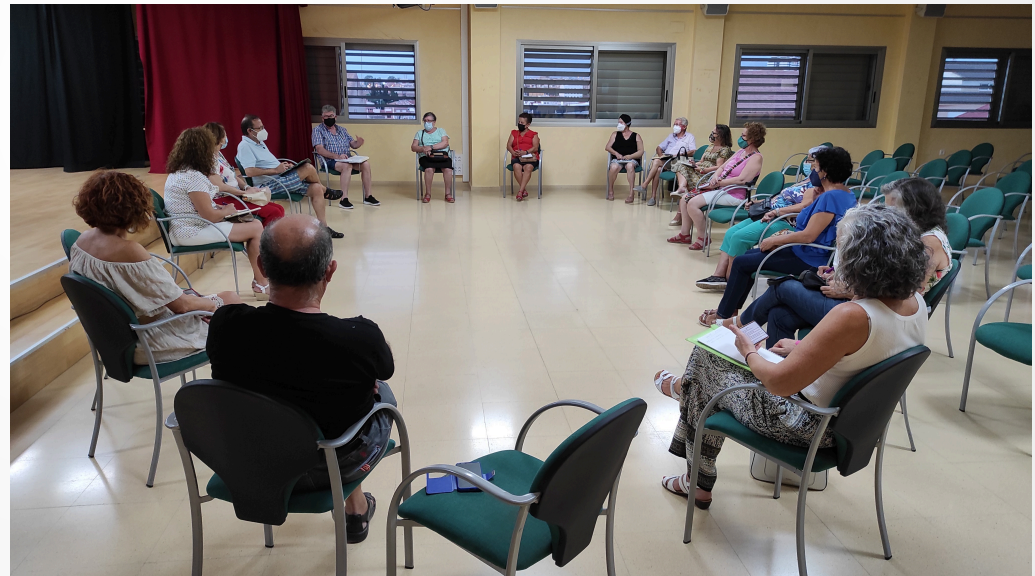
Conseil de la Zone 2