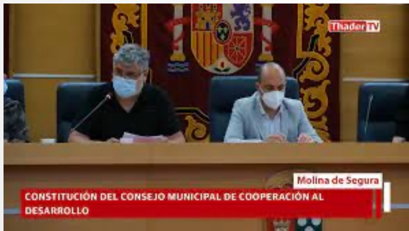
Conseil Municipal de Coopération au Développement (en haut) et du Bien-Être Social (à droite)