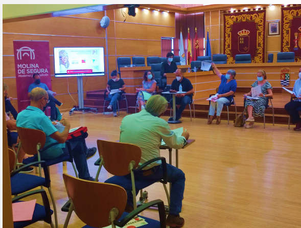
Conseil Local de Participation Citoyenne

Composition : Conseil de direction + assemblée