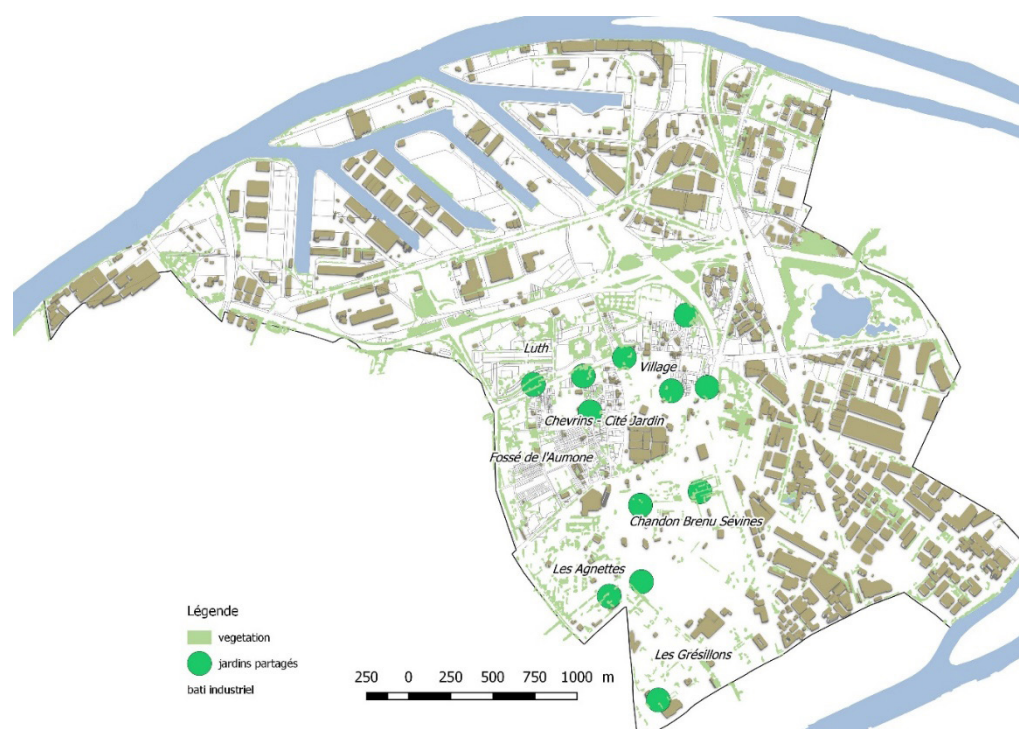
Figure 2. Gennevilliers, ses quartiers et ses jardins partagés.