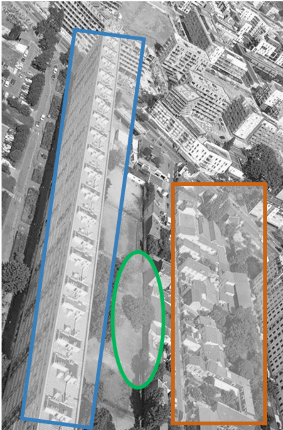
Figure 4. Le jardin partagé des Agnettes, une couture entre deux espaces urbains séparés ? The Agnettes' garden, a join between two separated neighborhoods.

partagés genevillois sont à la fois des vecteurs de liens sociaux, des outils de formation (ou d'autoformation) et de sensibilisation à l'agriculture urbaine, ils sont aussi des facteurs de préservation de la biodiversité en ville mais aussi enjeux d'une réappropriation de la ville par ses habitantes et habitants/citoyennes et citoyens (Den Hartigh, 2013).